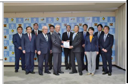
川合よしあき市長と自由民主党川越市議団(牛くぼ:左から3番目)